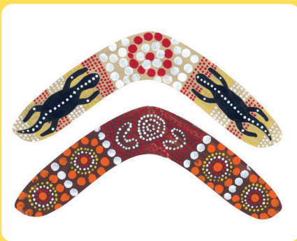
Voorbeeld van kartonnen boemerang met stipjes

Saïd en Anna zien voor het eerst een heel mooie boemerang. Kunnen de kinderen er ook zo een versieren op papier? Je kunt gebruikmaken van het werkblad, of kinderen hun boemerang zelf laten ontwerpen. Australische boemerangs zien er erg mooi uit. De Aborigines, een oud volk dat in Australië woont, versieren ze als echte kunstwerken. Ze maken er gekleurde patronen op (werkblad) of kiezen een kleur als ondergrond en maken dan met stipjes verf de mooiste vormen. Knip uit karton de vorm van de boemerang en versier deze met verf. De stipjes kun je heel goed maken met wattenstaafjes die je in de verf doopt en dan stempelt.