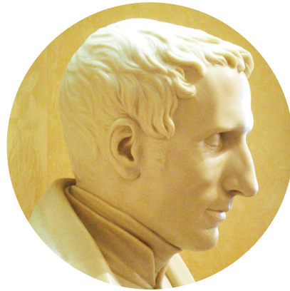
Een buste van Louis Braille

Wat? Als je blind bent, kun je geen gewone boeken lezen. Daar vond de blinde Fransman Louis Braille iets voor uit toen hij 15 jaar was: het brailleschrift. Dat zijn puntjes die je met je vingers kunt voelen. De puntjes steken telkens net iets anders uit het papier, zodat je alle letters van het alfabet hebt.